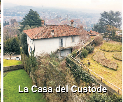
La Casa del Custode